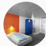
Estabelecimentos de Hospedagem